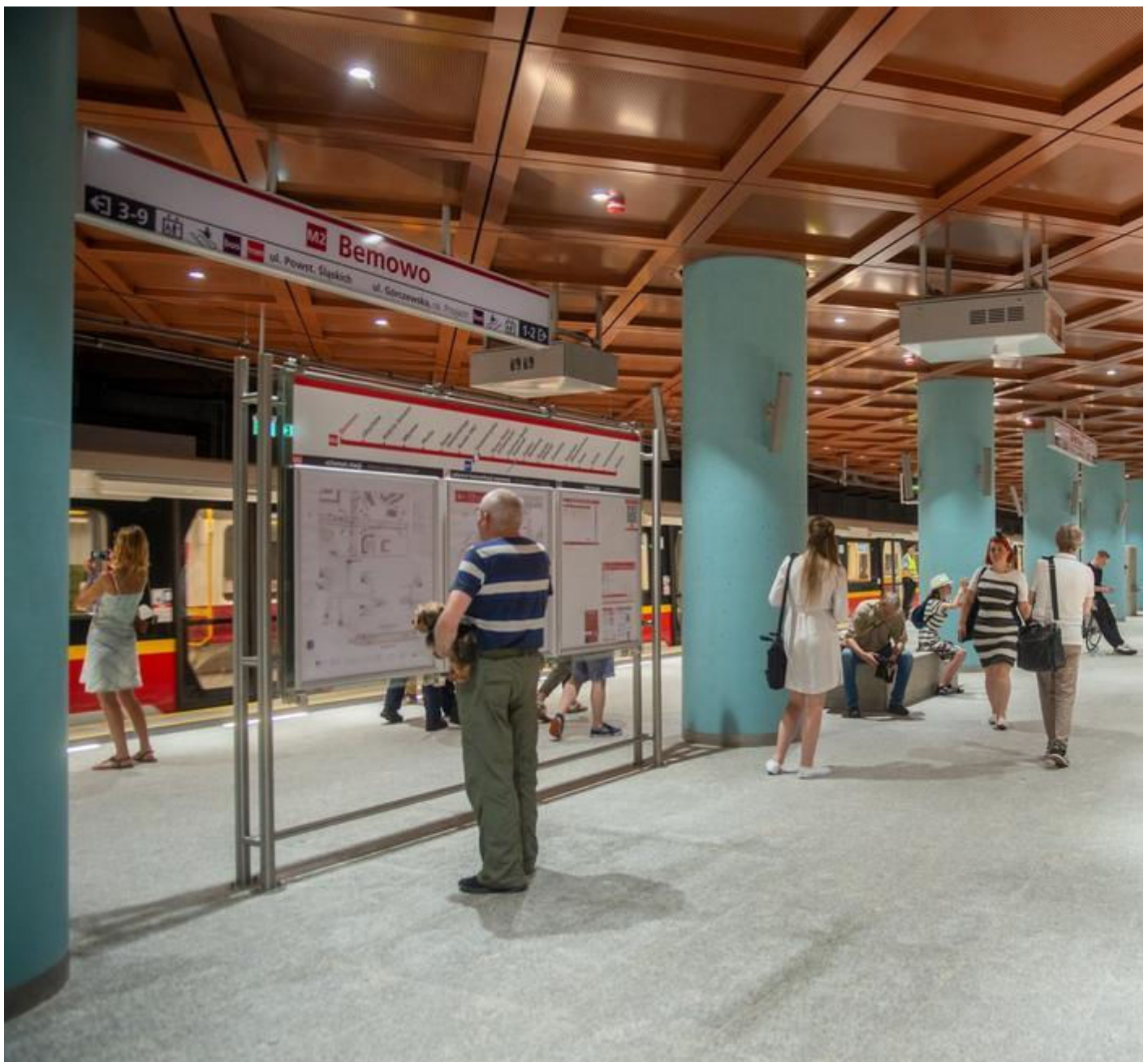
Nowe stacje II linii metra na Bemowie

Na powierzchni, przy wyjściach ze stacji metra na Bemowie pojawiły się też stalowe konstrukcje wiat obudowane szkłem oraz pokryte cegłą szyby windowe. W rejonie przystanków odtworzono ponadto zieleń. Jak wylicza biuro prasowe ratusza, łącznie posadzono dokładnie 333 drzewa. Większość przy stacji Bemowo.