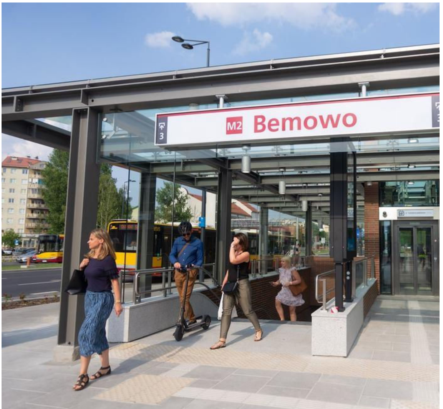
Nowe stacje II linii metra na Bemowie