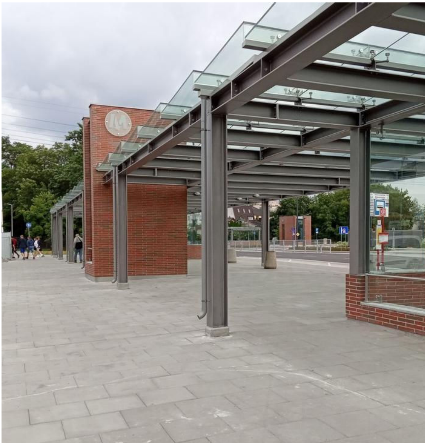
Nowe stacje II linii metra na Bemowie