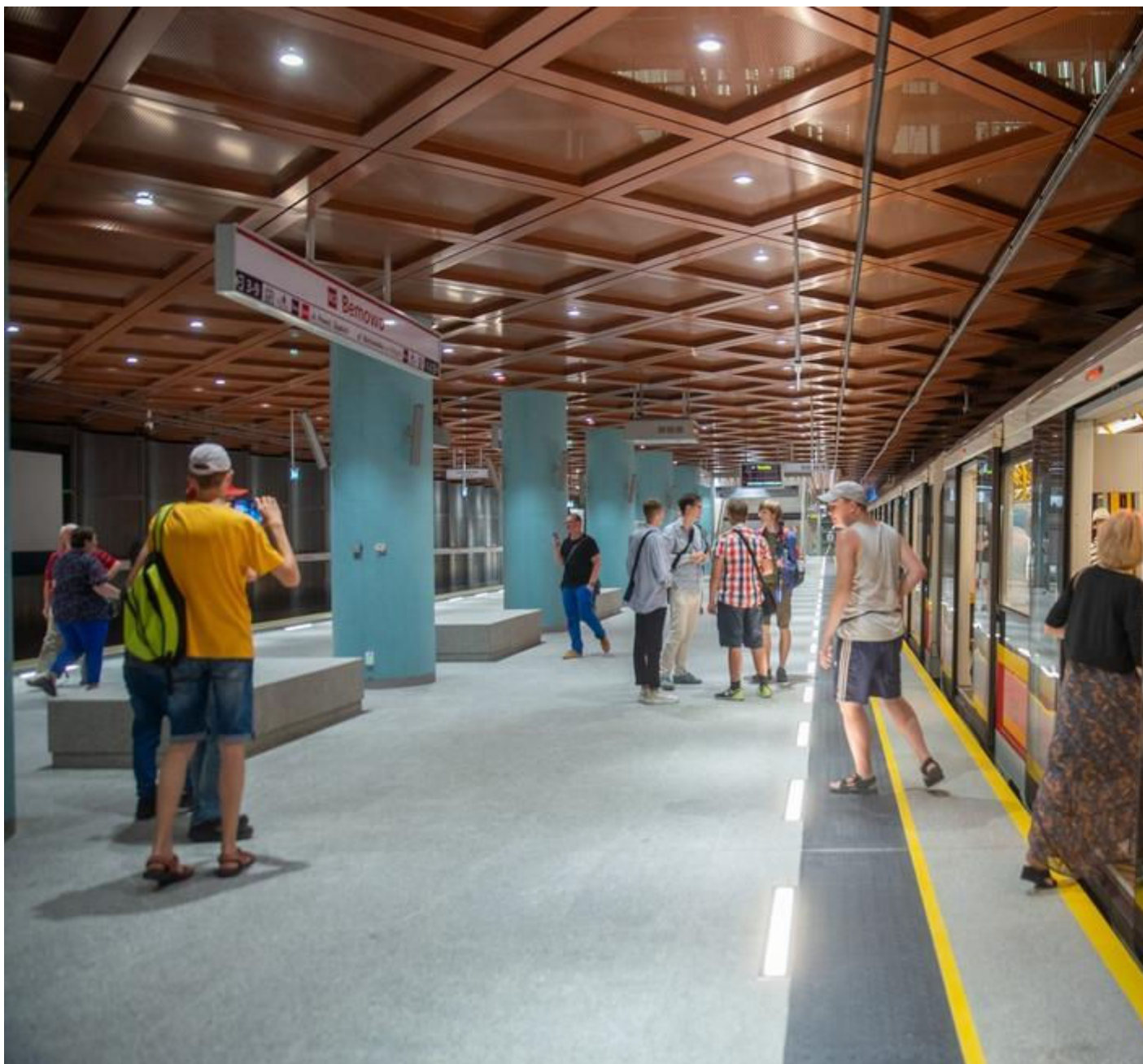
Nowe stacje II linii metra na Bemowie