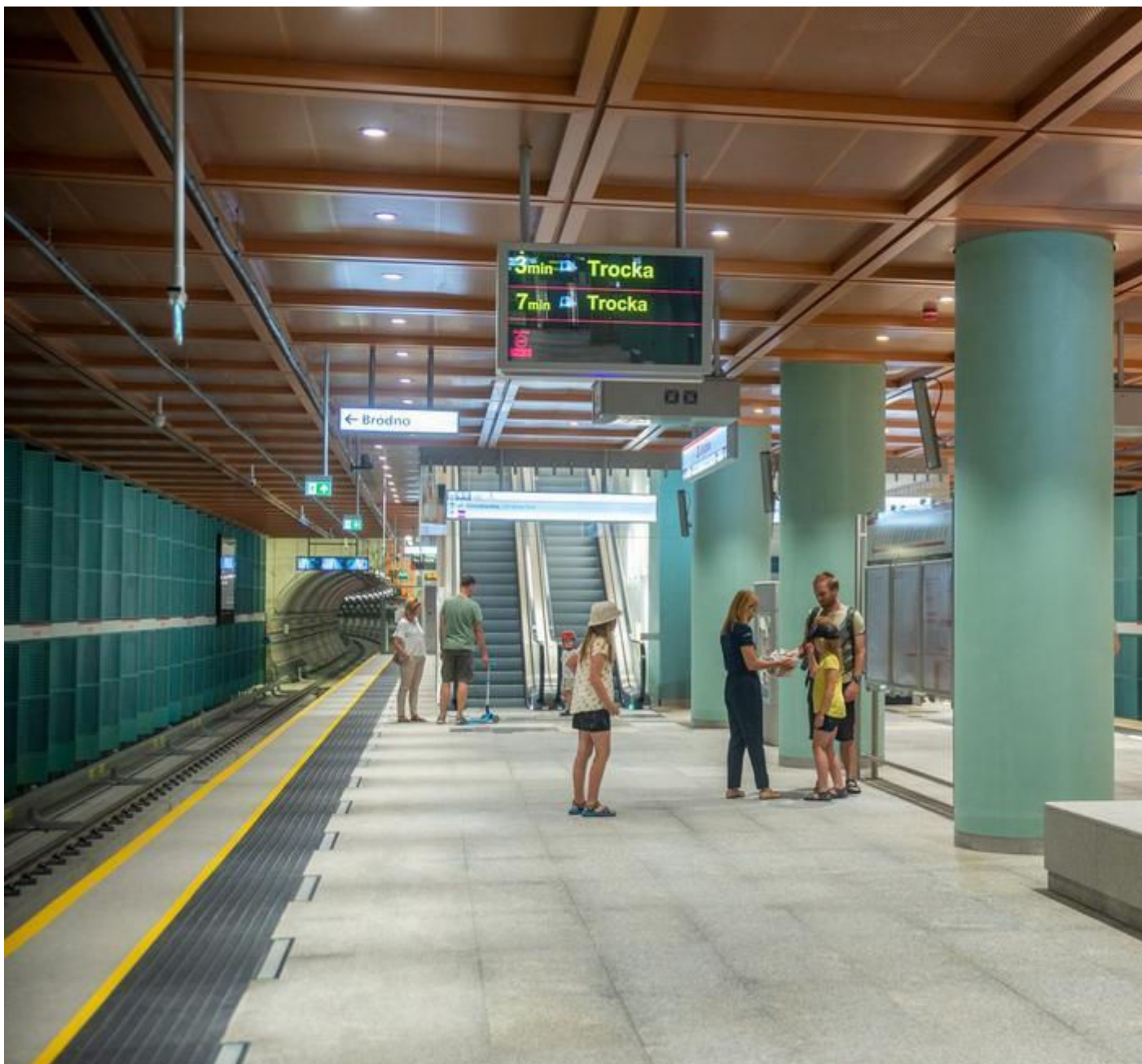
Nowe stacje II linii metra na Bemowie

Newsletter „Architektury-murator” co tydzień nowa porcja najświeższych architektonicznych newsów z Polski i ze świata!