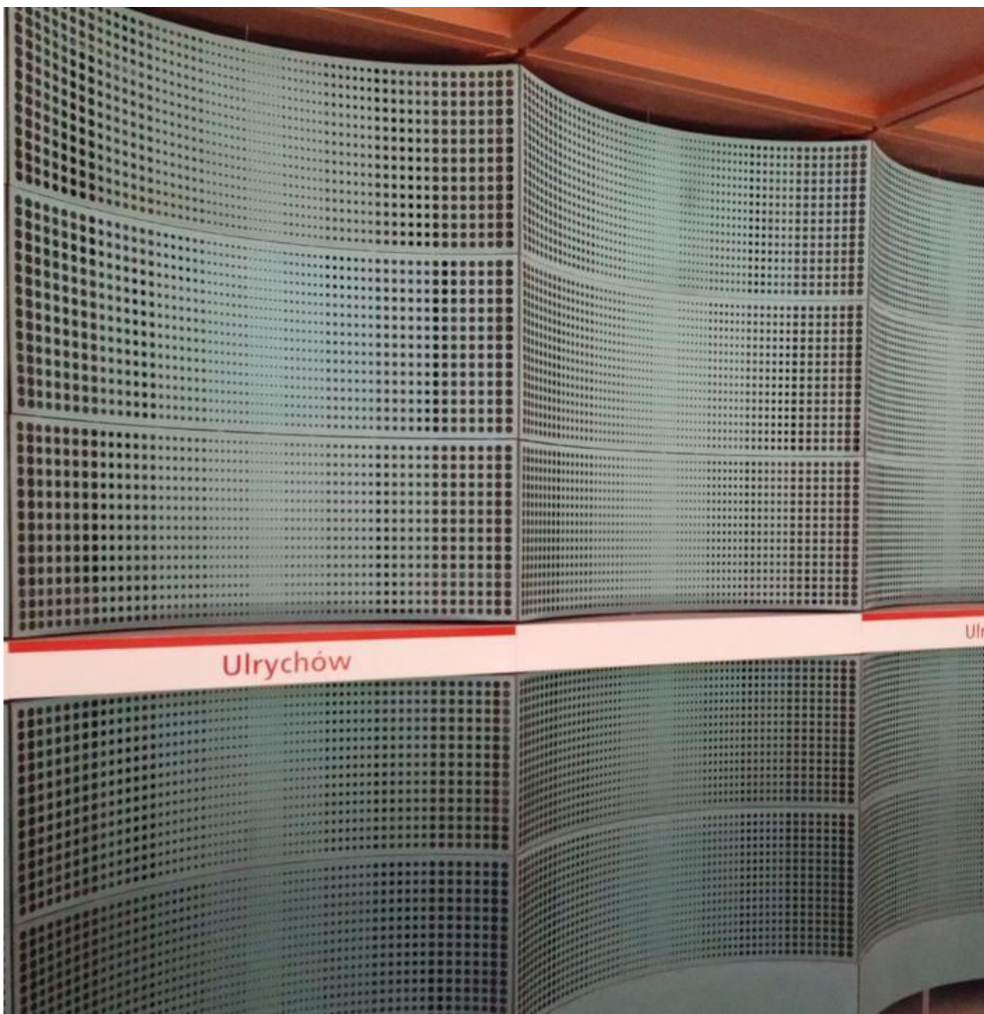
Nowe stacje II linii metra na Bemowie