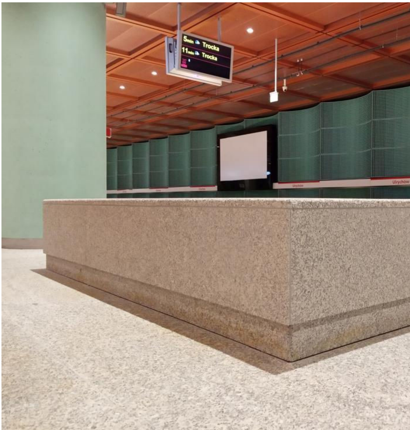
Nowe stacje II linii metra na Bemowie