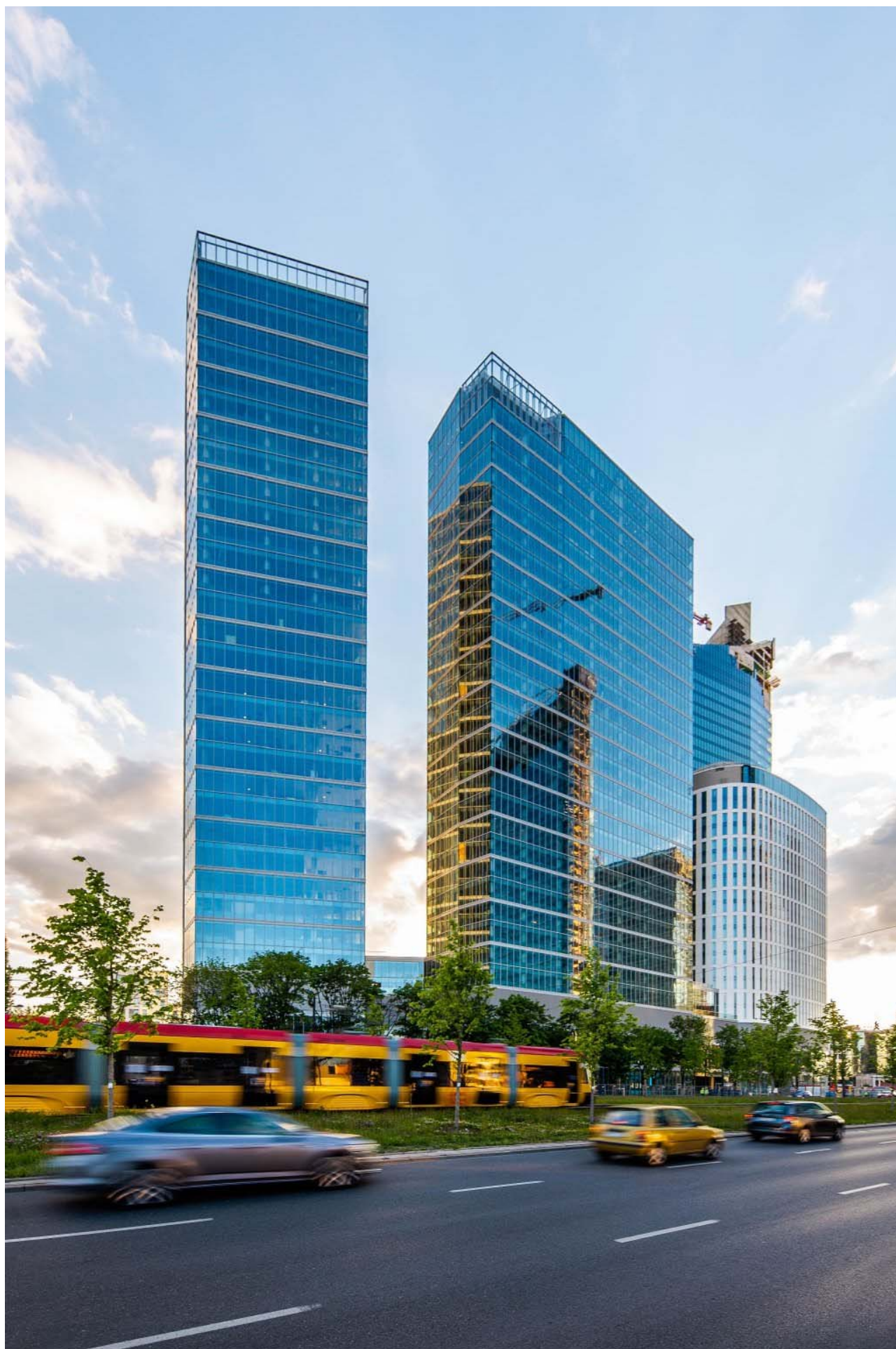
Seule la tour hôtelière du nouveau complexe Warsaw Hub n'a pas été cédée à Google Pologne.