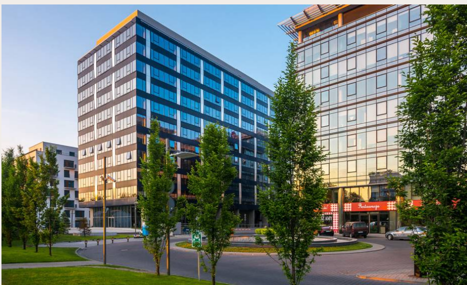
📷 Biurowiec Wołoska 24 w Warszawie