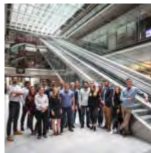
( https://builderpolska.pl/wp-content/uploads/2018/11/ZDJĘCIE-GRUPOWE-AMC.jpg )