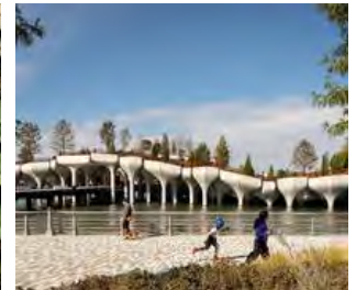
LITTLE ISLAND W NOWYM JORKU OD HEATHERWICK STUDIO