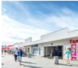
TARGOWISKO BAKALARSKA W WARSZAWIE