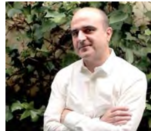
VICENTE GUALLART: MIASTO SAMOWYSTARCZALNE