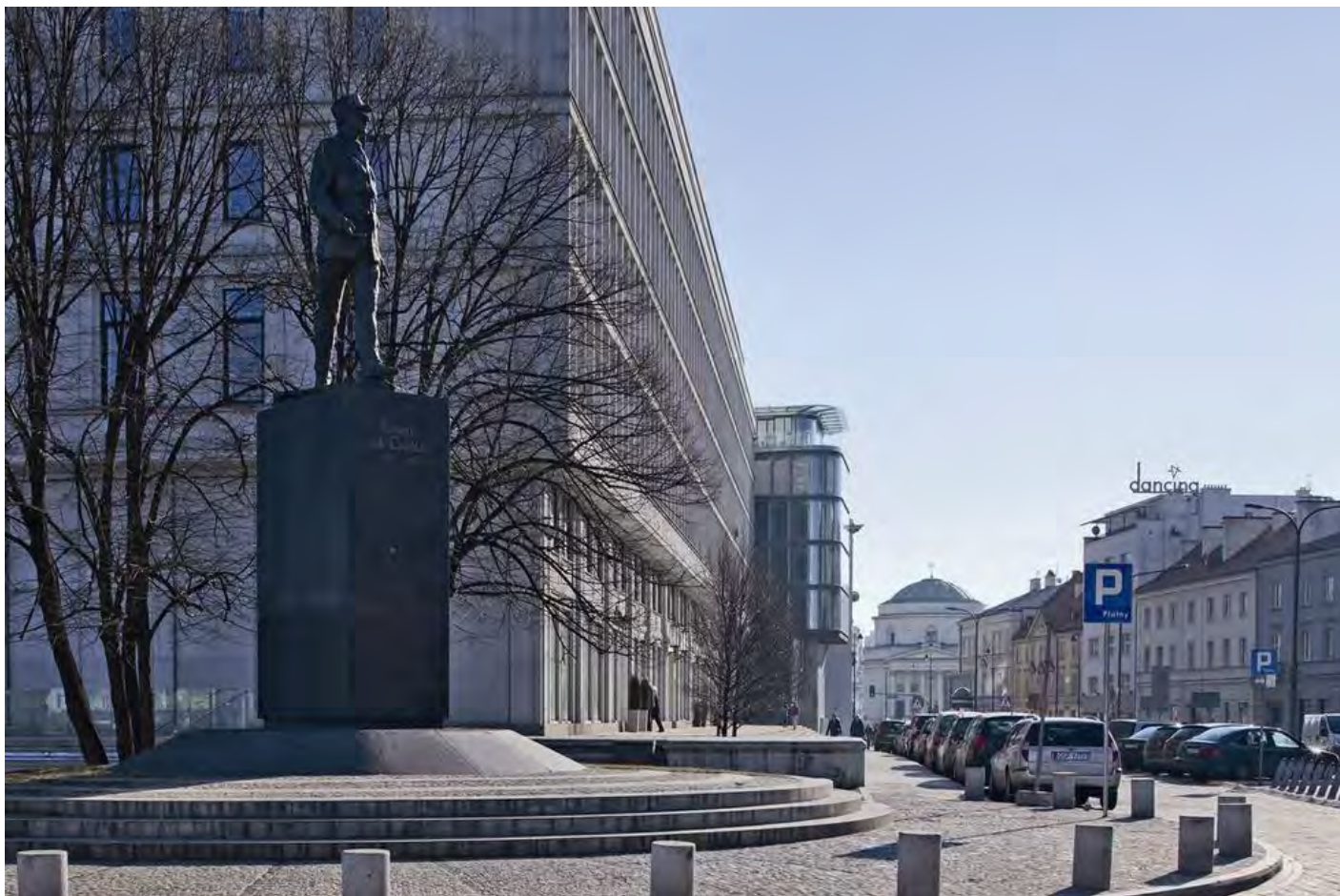
Biurowiec widoczny z Ronda de Gaulle'a, wciśnięty pomiędzy istniejącą zabudowę i zwrócony szczytem do Traktu Królewskiego wydaje się obiektem niewielkim o kontekstualnej architekturze; w głębi kościół św. Aleksandra na placu Trzech Krzyży.

połączenia Traktu ze skarpą warszawską jest wynikiem tych założeń. Budynek przekształca miejsce dotychczas uznawane za zapleczone i peryferyjne w przestrzeń rozpoznawalną i posiadającą własną tożsamość. Zmieniła się intensywność emocjonalnego odbioru i jakości kulturowej tego fragmentu Traktu Królewskiego. Nowy Świat 2.0 stosownie i taktownie wypełnia swe miejsce w głównych sylwetkach urbanistycznych kwartału.