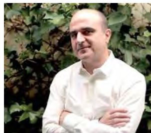
VICENTE GUALLART: MIASTO SAMOWYSTARCZALNE