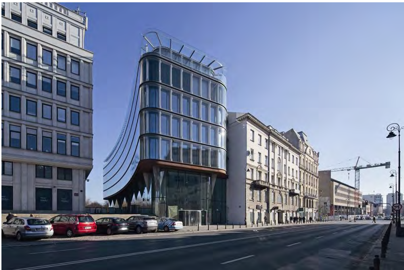
Północna, wklęsła elewacja budynku kreuje nową przestrzeń publiczną.

Biurowiec ten stanowi w istocie rozbudowę byłego Domu Partii, chociaż w miejskiej przestrzeni jest pozornie niezależnym budynkiem. Wciśnięty między istniejącą zabudowę i zwrócony szczytem do Traktu Królewskiego wydaje się obiektem niewielkim, o ostrożnej, kontekstualnej architekturze. W rzeczywistości stał się pretekstem dla odważnych działań, które odmieniły całe jego sąsiedztwo w oryginalną przestrzeń publiczną. W inwestycji tej, w dużej mierze polegającej na kilku przemyślanych interwencjach, nie chodziło jedynie o wąski budynek, dzięki któremu wyzyskano dodatkową kubaturę. Tematem był kluczowy dla Śródmieścia pokaźny kwartał pomiędzy Książęcą, Nowym Światem a Alejami Jerozolimskimi.