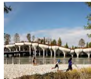
LITTLE ISLAND W NOWYM JORKU OD HEATHERWICK STUDIO