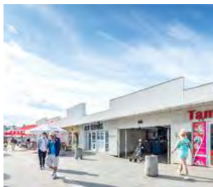
TARGOWISKO BAKALARSKA W WARSZAWIE